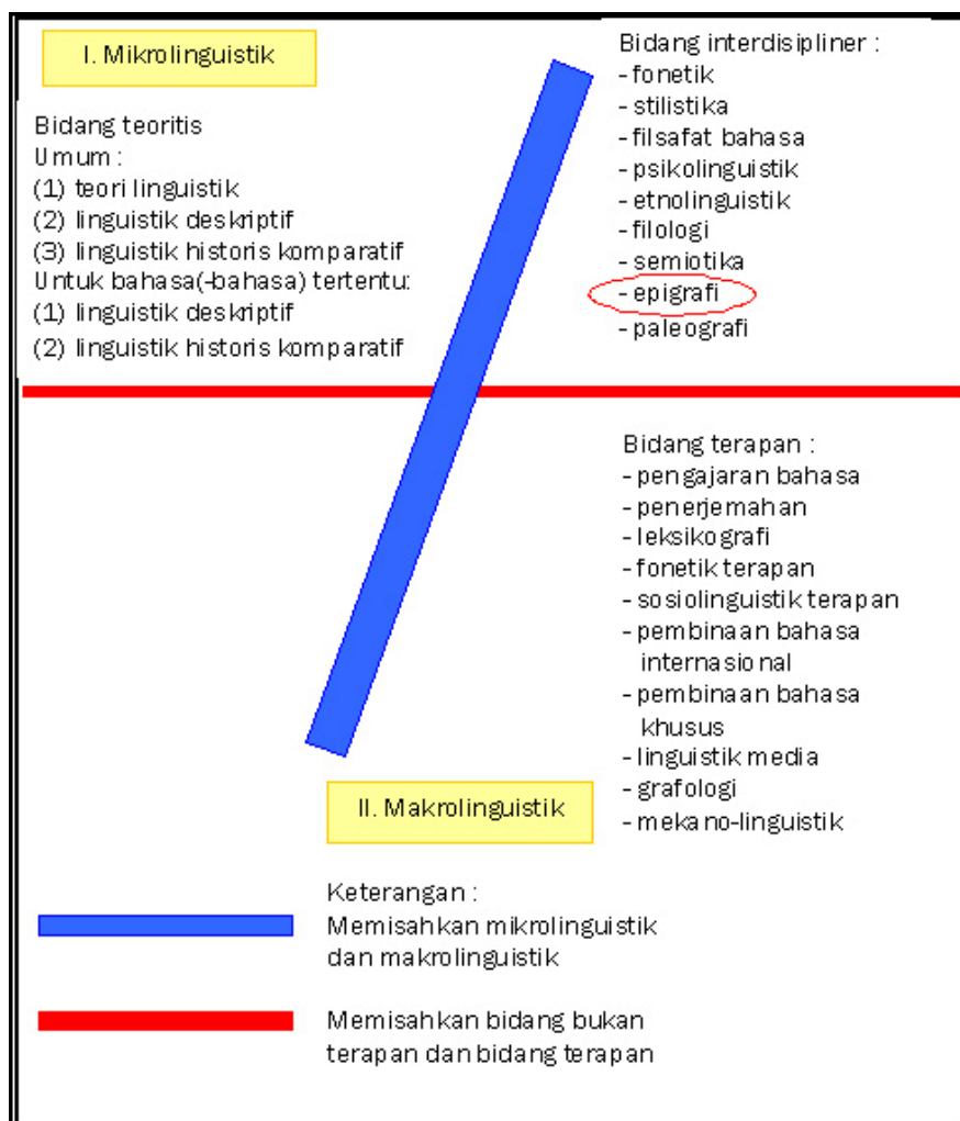
Gambar 1 Pembedaan Linguistik (Dikutip dari Harimurti Kridalaksana, 1982: xxviii)

Kajian terhadap tulisan di atas bahan (lazim disebut sebagai epigrafi) diperlukan sebuah jalinan metode dari berbagai disiplin seperti arkeologi, sejarah dan linguistik sebagai upaya mengenali kembali gejala-gejala kebudayaan di masa lampau. Sampai saat ini kajian epigrafi secara mandiri dapat disebut 'bukan milik siapa-siapa' di antara ketiga ilmu tersebut, meski secara akademis kajian epigrafi dimasukkan dalam kurikulum studi arkeologi. Disiplin sejarah dengan obyek studi tinggalan tertulis termasuk di dalamnya prasasti menempatkannya pada derajat kesaksian tertinggi karena prasasti ditulis pada masa yang sejaman dengan penulisnya, meski tak dapat diabaikan pula adanya prasasti yang ditulis ulang ( tinulad ). Adapun dengan arkeologi yang secara epistemologis - metodologis mengkategorikan epigrafi hanya sebagai ilmu bantu ( auxilliary science ) dalam rangka merekonstruksi perikehidupan manusia masa lampau melalui tiga paradigmanya. Untuk studi linguistik juga sama halnya. Berikut adalah bagan sederhana yang dikutip dari Harimurti Kridalaksana (1982) dalam kaitannya dengan pembedaan linguistik yang secara jelas menampakkan posisi epigrafi dalam studi linguistik secara keseluruhan,