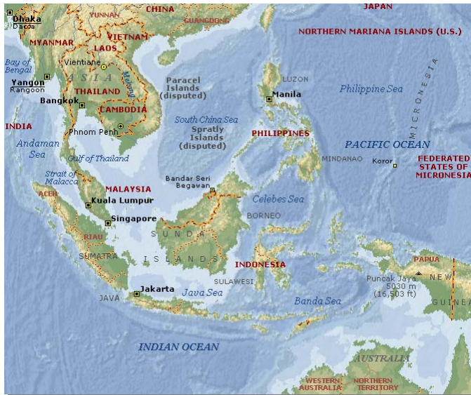
Daratan Sunda, Zona Wallacea, dan Daratan Sahul

Pada Kala Pleistosen Akhir, kehidupan manusia berada pada tingkat teknologi mesolitik yang mengandalkan pada pola subsistensi perburuan dan pengumpulan sumber-sumber alam. Pada masa itu manusia telah memanfaatkan bentukan alam seperti gua dan ceruk, yang digunakan sebagai tempat tinggal (Nurani, 1996:12). Walaupun manusia pada masa tersebut memiliki pola subsistensi yang memungkinkan mobilitas yang tinggi, tetapi rupa-rupanya mereka cenderung menetap pada tempat hunian induk yang didukung dengan lokasi hunian penyangga. Bukti arkeologis dari lokasi hunian induk pada masa mesolitik menggambarkan bahwa lokasi tersebut digunakan secara berkesinambungan dalam kurun waktu yang cukup lama, misalnya Song Terus 180.000-4.500 BP (Simanjuntak, 2000). Dalam sistem ekonomi pemburu pengumpul, sangat tidak efektif jika mereka harus merubah atau mencari tempat yang baru bagi hunian induk mereka, sebab suatu proses perpindahan akan memerlukan biaya dan pengorbanan. Di samping itu, manusia juga pasti memperhitungkan bahaya yang mungkin dijumpai di tempat barunya.