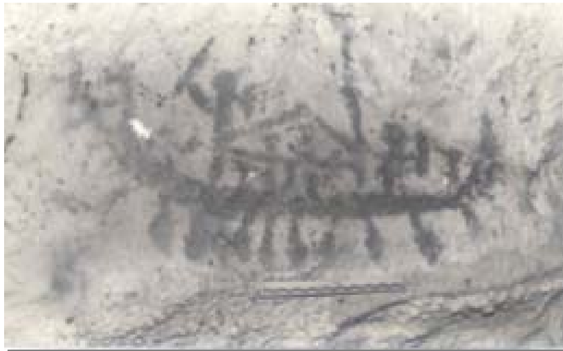
Lukisan Dinding Gua, Orang Naik Perahu, Pulau Muna, Sulawesi Tenggara

menyiapkan alat lainnya yang terbuat dari bahan non-litik (Hutterer, 1977:52-54). Bambu mungkin merupakan pilihan yang tepat untuk digunakan sebagai bahan alat transportasi air. Sebab tumbuhan tersebut mengandung unsur silika tertentu yang cukup kuat bertahan di air (kedap air). Selain itu, rongga yang terdapat pada bagian dalam batang tumbuhan tersebut dapat menghasilkan daya apung yang cukup baik. Dari 35 spesies bambu yang ada di dunia, 13 spesies dapat ditemukan di Jawa (Birdsell, 1977:143-144). Selain bambu, Geoffrey Irwin mengajukan beberapa bahan yang mungkin dapat digunakan sebagai bahan, seperti: serat tumbuhan, pohon pandan dan pohon kelapa. Bahan ini juga memiliki tingkat bahaya yang kecil bila digunakan di air (Irwin, 1992:44).